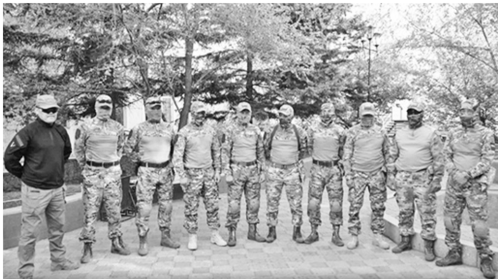
С начала спецоперации на Донбасс уехало больше трёхсот жителей республики

Спецоперация на Украине не оставила жителей Бурятии равнодушными, уже многие поехали на фронт добровольцами. С её началом из республики на Донбасс уехало более 300 человек, очередная группа отправилась из Улан-Удэ 26 мая.